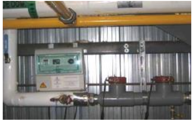
Système d'ionisation cuivre et argent monté en by-pass sur la conduite principale d'eau chaude.

Les traitements curatifs traditionnels ont montré leurs limites d'efficacité et leurs nombreux inconvénients, incluant les dangers pour la santé et la sécurité. Le système d'ionisation cuivre et argent distribué par H 2 O Tech Abitibi propose une approche 100% écologique, tant curative que préventive, qui permet en plus la réalisation de substantielles économies.